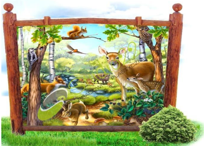
Ryc. 2 Przykładowy wygląd

W sylwetkach zwierząt lub postaci wycięte są otwory, w których uczestnicy zabawy edukacyjnej umieszczają twarze, aby wykonać zdjęcie upamiętniające spotkanie z przyrodą. Otwory są zasuwane od tylnej strony właściwym fragmentem sylwetki danego zwierzęcia lub postaci. Małe dzieci mogą skorzystać ze specjalnego podestu umożliwiającego umieszczenie