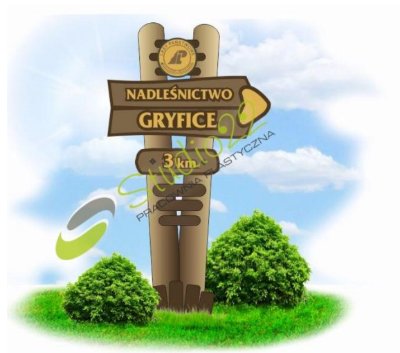
Ryc. 6 Przykładowy wygląd