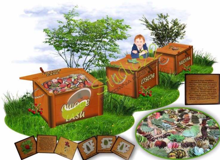
Ryc. 3 Przykładowy wygląd

Tablica wykonana ze sklejki wodoodpornej o grubości minimum 10mm lub PCV spienione o grubości 10mm.