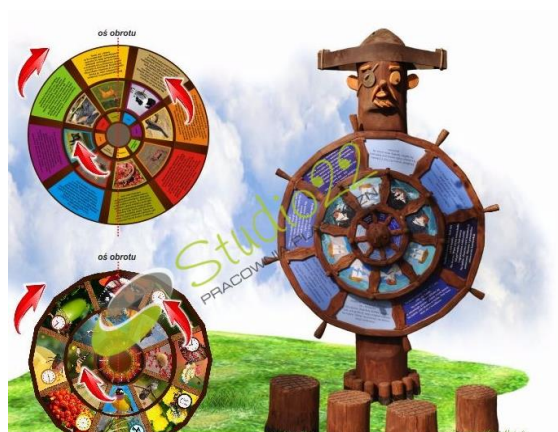
Ryc. 1 Przykładowy wygląd

Trzy koła o różnych rozmiarach obracają się wokół wspólnej osi, na której osadzone są poziomo. Płaszczyzny kół podzielone są na 8 równych części, każda z nich pomalowana jest na inny kolor. Na zewnętrznym kole, które ma największy promień, znajduje się krótki opis, w kole o średnim promieniu umieszczona jest zdjęcie opisywanego zwierzęcia, rośliny, ptaka itp. natomiast wewnętrzne koło zawiera jego nazwę.