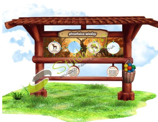
Ryc. 5 Przykładowy wygląd