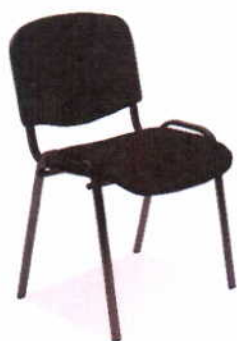
Krzesło ISO- sołectwo Grądy (fot.2)