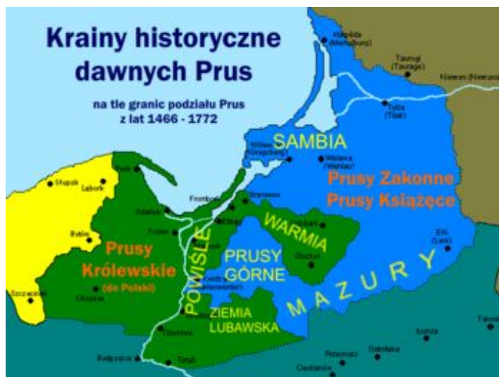
Rys. Nr 2 Historyczny podział administracyjny.

Nazwa wsi jest wymieniana po raz pierwszy na dokumencie z 1336 roku przy opisie dóbr Zwiniarz. W 1371 roku biskup chełmiński Wikbold odnowił przywilej lokacyjny dla Hartowca na prawie chełmińskim. Wieś liczyła wtedy 44 łany (łan chełmiński, czyli włóka=16,7 ha). Lokalizacja na prawie chełmińskim połączona była z wytyczeniem regularnej zabudowy i podziałem działek w układzie niwowym. Tak dość wczesna