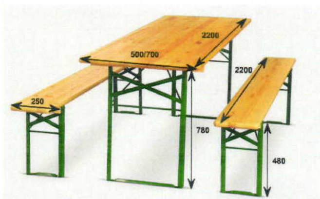
Komplet piwny- stół składany i 2 ławki składane sołectwo Jeglia i Tuczki (fot. 4)