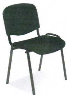
Krzesło ISO- sołectwo Koszelewy i Rapaty (fot.1.)