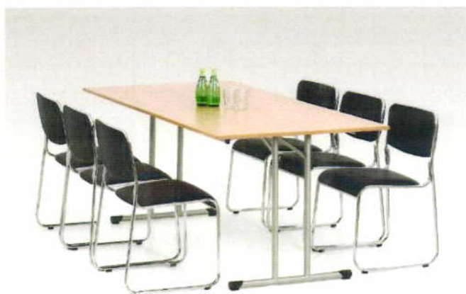
Stół Gordon –sołectwo Koszelewy (fot.2 i 3)